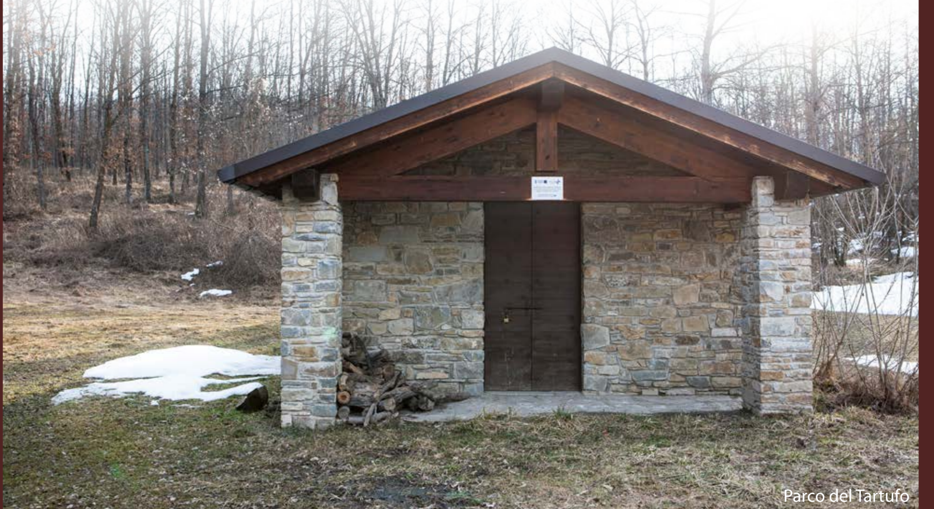
Parco del Tartufo

There are two characteristic truffle varieties of the area: Tuber magnatum , commonly called white truffle or trifola, universally regarded as the most prestigious of all, and the Tuber aestivum , better known as black truffle .