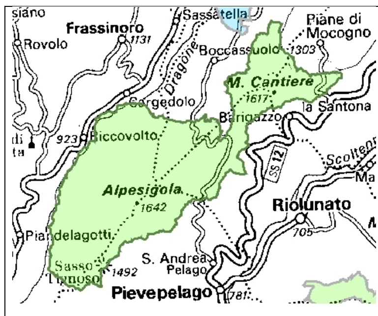
Il SIC-ZPS Alpesigola, Sasso Tignoso e Monte Cantiere

A Nord del Parco Regionale dell'Alto Appennino modenese, come una lunga e articolata bastionata protesa verso il crinale, si estende un'area montana vasta e decisamente poco battuta dominata dall'Alpesigola (1640 m). Si tratta di un largo e articolato contrafforte, quasi un massiccio a sé stante che segna lo spartiacque Secchia-Panaro e si estende dal Torrente Dragone verso Est fino alla strada ducale Vandelli, spingendosi a valle fino al Passo Centocroci, che il sito oltrepassa fino ad inglobare l'intero massiccio del Monte Cantiere (1617 m). Arenarie, argille e marne calcaree arrotondate del Complesso Caotico caratterizzano gran parte del sito, lasciando il posto sul lato meridionale a due importanti affioramenti ofiolitici, quello più piccolo e aguzzo di Sasso del Corvo e quello più grande e tozzo del Sasso Tignoso. Questi blocchi basaltici, vere emergenze geologiche e naturalistiche, contengono tra l'altro rarissimi minerali (Prehnite e Zeoliti). Il sito è prevalentemente boscato (63%), con vaste faggete – qui sorgeva l'antica Selva Romana – qua e là interrotte da praterie (15%), laghetti e torbiere (significative sono le aree umide presso S. Antonio, Alpesigola e Monte del Rovinoso), arbusteti ed habitat rocciosi. Quasi