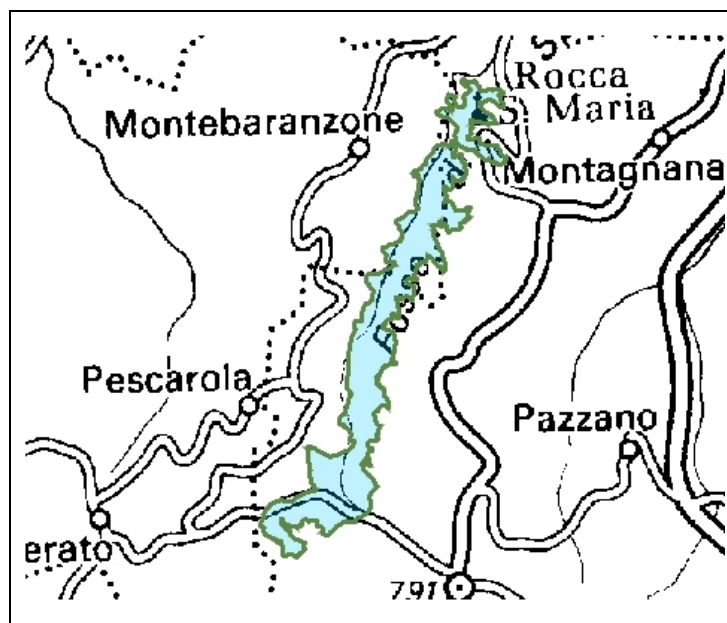
Il SIC Faeto, Varana, Torrente Fossa

Il sito, localizzato nel medio Appennino modenese, si estende in forma allungata per circa 7 km in direzione Sud-Nord lungo il corso del Torrente Fossa, dai Boschi di Faeto attraverso l'affioramento ofiolitico dei Sassi di Varana fino alle anse sottostanti Rocca S. Maria.